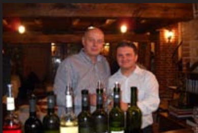
Од посетата на пријателите од Косово