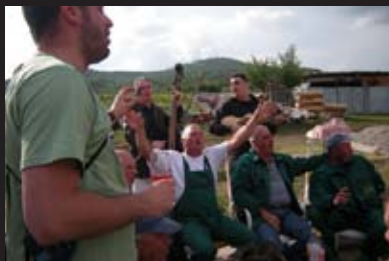
Од посетата на пријателите од Босна

Освен дружењето во ресторанот на „Тиквеш“ и во нокните клубови во Кавадарци, организиравме излет и разгледување на лозовите насади во Барово, како и посета на Велешко Езеро.